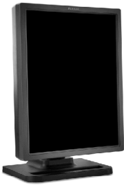
Dome E3n 数字平板显示器

检查你的 Dome E3n 显示器包装箱内的内容，所有部件都列在下面。为了将来运输和储藏的需要，请妥善保管所有包装材料。